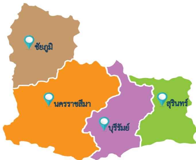
ภาพที่ 1 แผนที่แสดงพื้นที่รับผิดชอบสำนักงานศึกษาธิการภาค 13 (กลุ่มจังหวัดภาคตะวันออกเฉียงเหนือตอนล่าง 1)

สำนักงานศึกษาธิการภาค 13 ตั้งสำนักงานอยู่ ณ เลขที่ 54 ถนนสีปศิริ ซอย 3 ตำบลในเมือง อำเภอเมืองนครราชสีมา จังหวัดนครราชสีมา ซึ่งรับผิดชอบดำเนินการในพื้นที่กลุ่มจังหวัดภาคตะวันออกเฉียงเหนือตอนล่าง 1 ประกอบด้วย 4 จังหวัด ได้แก่ จังหวัดนครราชสีมา จังหวัดชัยภูมิ จังหวัดบุรีรัมย์ และจังหวัดสุรินทร์